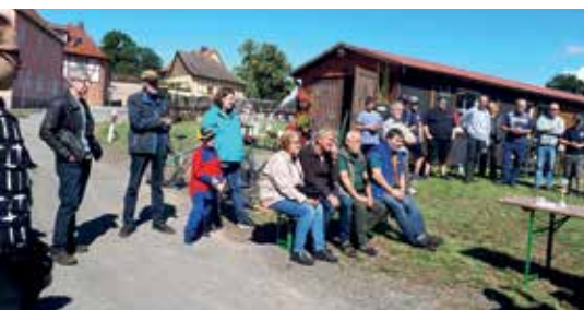
Teilnehmer aus 10 Vereinen verfolgen gespannt die Verkündung der Sieger.

bereich. Die Kategorien für alle Teilnehmer waren: Große Hähne, Leichte Hähne, Zwerghähne, Urzwerge und eine Jugendabteilung. Der Verein Großwechungen hatte auf Grund der momentanen Coronabeschränkungen alles vorbildlich vorbereitet. Unbedingt erwähnt werden muss der Einsatz unserer Jungzüchter ohne deren Hilfe das Kreishähnekrähen nicht so ein Erfolg gewesen wäre. Um 9:15 Uhr fiel der Startschuss zum 30-minütigen Wettkrähen. Nachdem all Stimmen ausgezählt waren, konnten die Sieger in den einzelnen Kategorien ermittelt werden. Der Sieger mit 79 Stimmen wurde der „Bantam-Hahn“ in der Kategorie Urzwer-