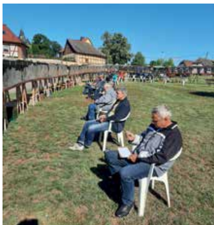
Hochkonzentrierte Kampfrichter beim Stimmzählen.

bereich. Die Kategorien für alle Teilnehmer waren: Große Hähne, Leichte Hähne, Zwerghähne, Urzwerge und eine Jugendabteilung. Der Verein Großwechungen hatte auf Grund der momentanen Coronabeschränkungen alles vorbildlich vorbereitet. Unbedingt erwähnt werden muss der Einsatz unserer Jungzüchter ohne deren Hilfe das Kreishähnekrähen nicht so ein Erfolg gewesen wäre. Um 9:15 Uhr fiel der Startschuss zum 30-minütigen Wettkrähen. Nachdem all Stimmen ausgezählt waren, konnten die Sieger in den einzelnen Kategorien ermittelt werden. Der Sieger mit 79 Stimmen wurde der „Bantam-Hahn“ in der Kategorie Urzwer-