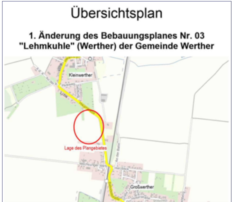
Darstellung ohne Maßstab

Fachliche und inhaltliche Erörterungen und Auskünfte zur o.a. Planung sind innerhalb der Öffnungszeiten oder nach gesonderter Terminabsprache möglich.