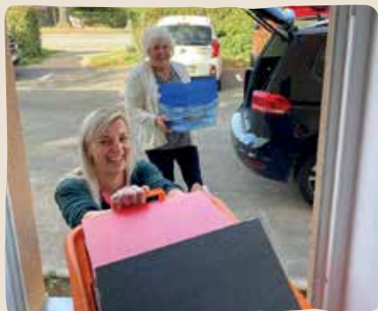
Der Umzug ist vollbracht. Der Pflegedienst von Miacosa arbeitet im neuen Quartier.

Am 1. November ist es soweit und unsere neue Senioren-Wohngemeinschaft in Sollstedt öffnet ihre Türen.