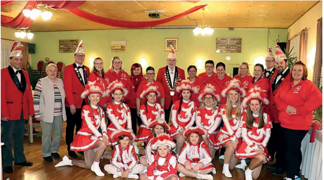
Günzeröder Fickelschwänze gehen in die Jubiläumssaison 65 Jahre Günzeröder Carneval Verein e.V.