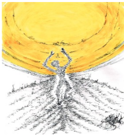
Original: Moll-Horstmann: 'Wurzeln eines Gai' herolds, 2019, Mischtechnik auf Papier, 30 x 24 cm